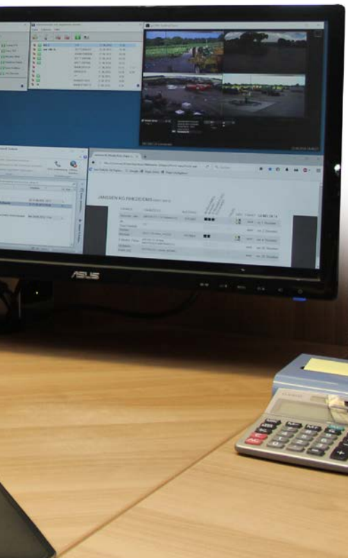
Dank der selbst mitentwickelten Software läuft die Disposition im Lohnunternehmen Janssen über zwei solche Arbeitsplätze seit dem 9. März 2015 papierlos.

com-LU von Claas. Das ist ein PC-gebundenes Management-System für die Rechnungsstellung. Das erste internetbasierte System im Betrieb Janssen war das Farmpilot (profi 1/2011, Seite 84). Das funktionierte soweit gut, erfüllte aber einige Anforderungen nicht. Zum Beispiel gab es Probleme für die Fahrer in Funklöchern, und die Disposition war nicht flexibel genug.