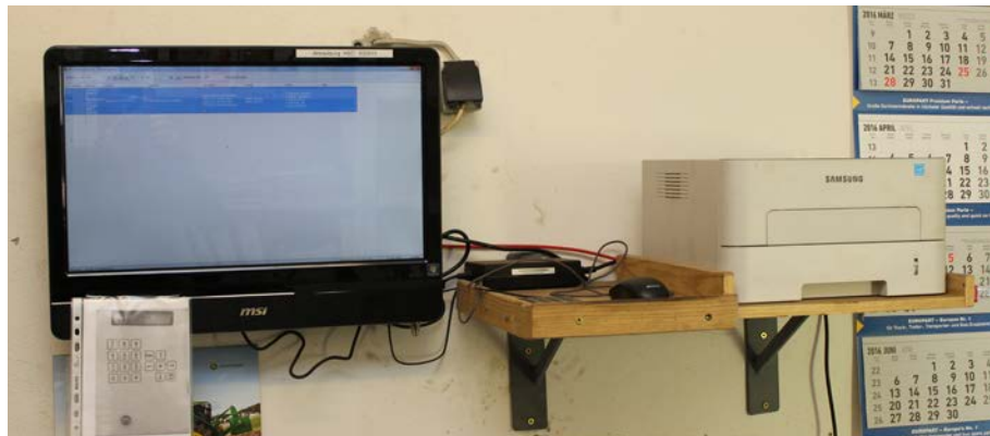
Der PC nebst Drucker im Werkstatt-Büro ist mit dem EFM verbunden und kann Aufträge für Aushilfsfahrer ohne iPhone, iPad oder Handy auf Papier drucken.

Mit einem Klick in die jeweilige E-Mail öffnet sich zunächst die Auftrags-App. Diese holt sich die relevanten Daten daraufhin aus einer internet-basierten Datenbank von Amazon, die lediglich als Datendrehzscheibe und nicht als Speicher dient. Über die Dispo-App oder das Web-In-