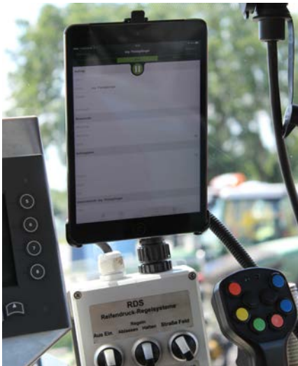
Ein iPad dient zur Auftragsfassung – mit der Besonderheit, dass keine sensiblen Daten auf dem Gerät sind und es keine Dauerverbindung zum Hauptsystem gibt.

Das ist im Betrieb Janssen inzwischen die Mehrzahl. Auf den Geräten sind jeweils spezielle Janssen-Apps installiert, die es derzeit nur für iOS-Geräte gibt: